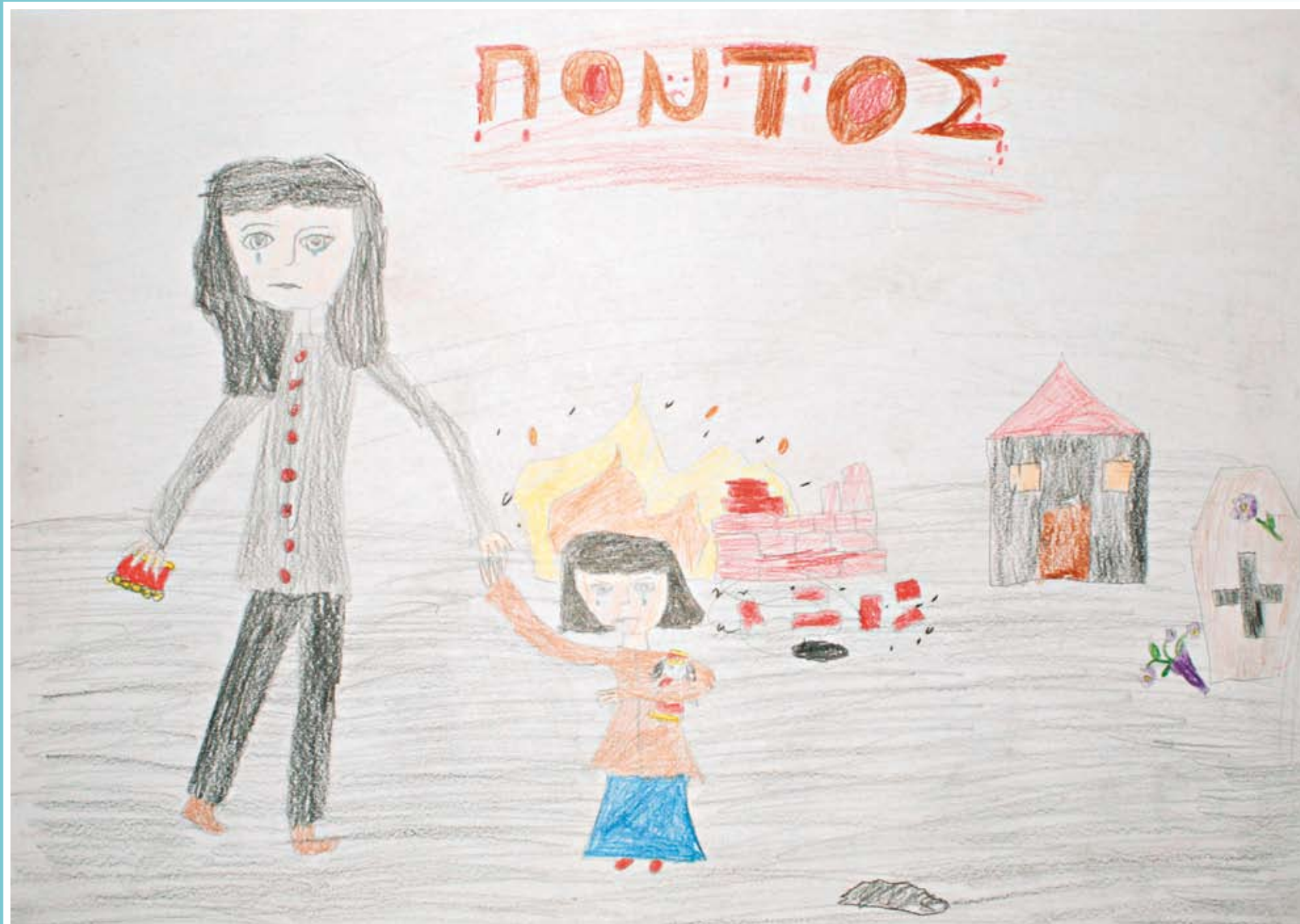
Δημοτικό 7ο Βραβείο: Μαμάτσιου Βασιλική-Καραγιορδανίδου Μαριαλένα, Δημοτικό Σχολείο Γ. Κοντάρης