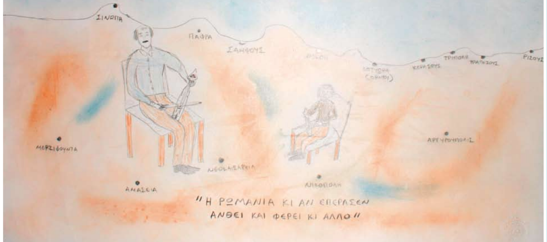
Δημοτικό 2ο Βραβείο: Χανταβαρίδης Χρήστος - Γρηγόρης, Δημοτικό Σχολείο Μαυροδενδρίου

ΕΠΙΣΤΗΜΟΝΙΚΟ ΤΙΤΛΟ ΕΡΓΑΣΙΑΣ: Ο ΜΟΥΤΟΣ ΚΑΙ Η ΠΑΡΑΔΟΣΗ ΣΤΟΥ ΜΟΥΤΟΥ