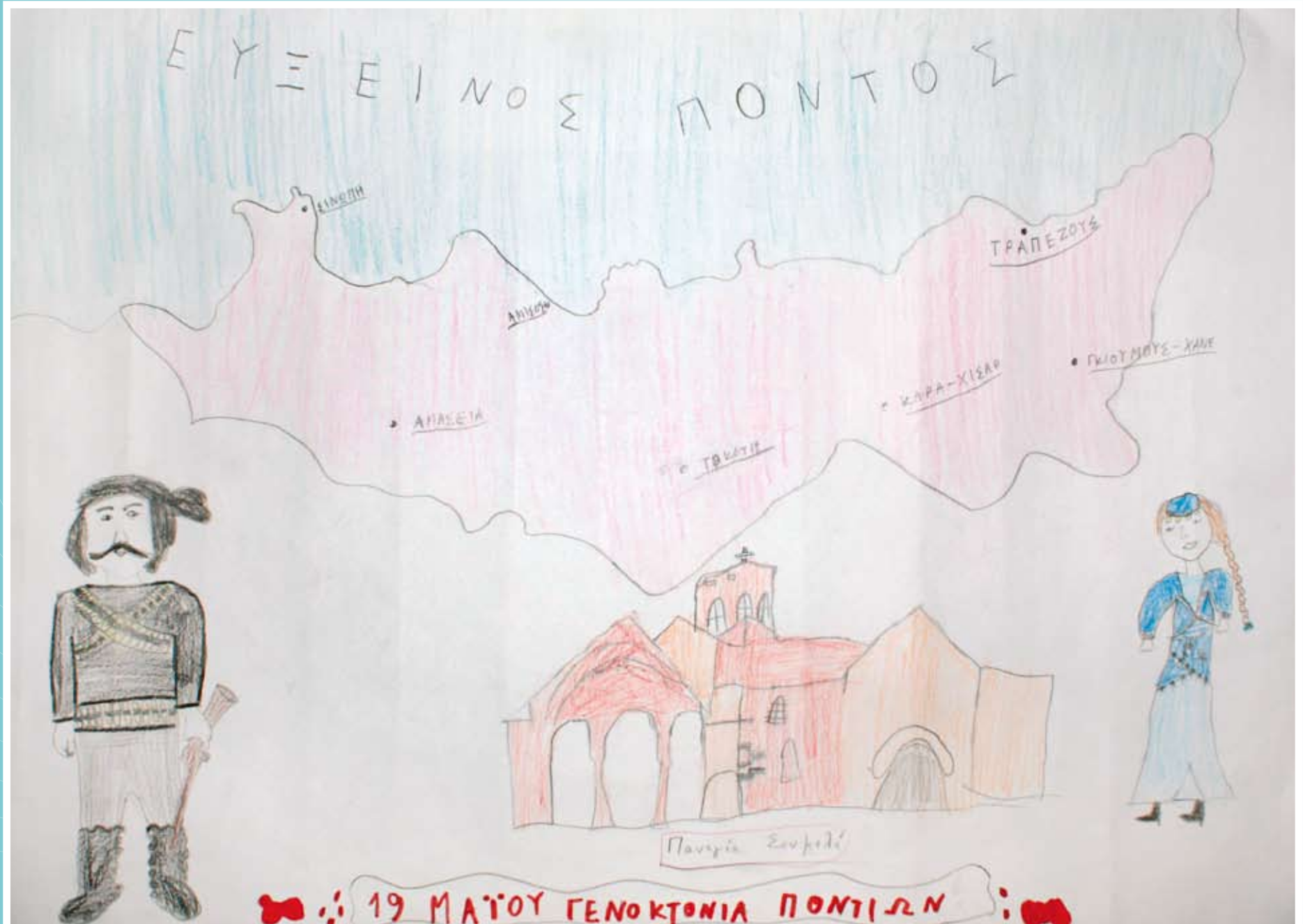
Δημοτικό 9ο Βραβείο: Τοπαλίδου Κατερίνα, 8ο Δημοτικό Σχολείο Σερρών.