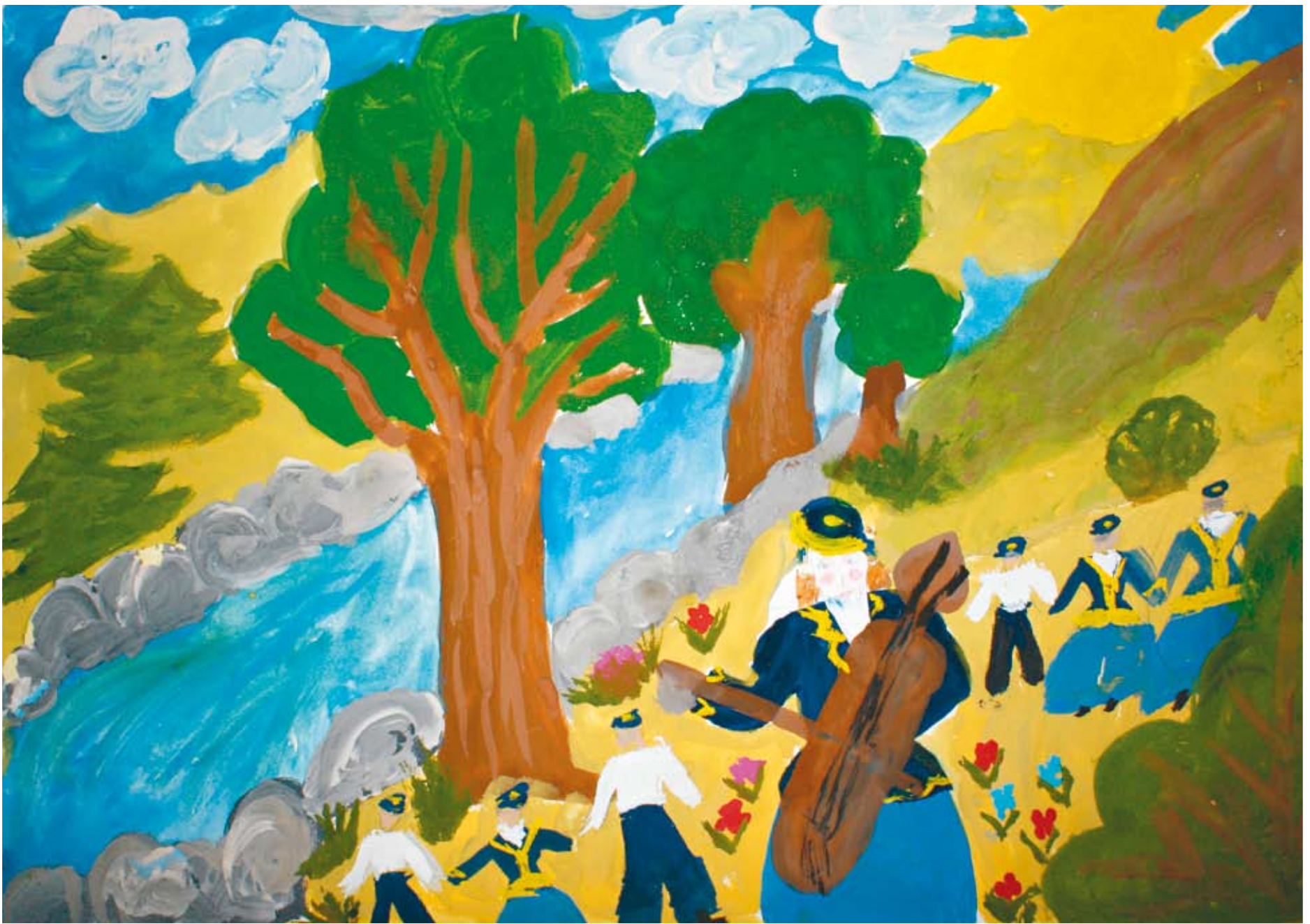
Δημοτικό 1ο Βραβείο: Μπαζδάνη Μαρία , 8ο Δημοτικό Σχολείο Σερρών