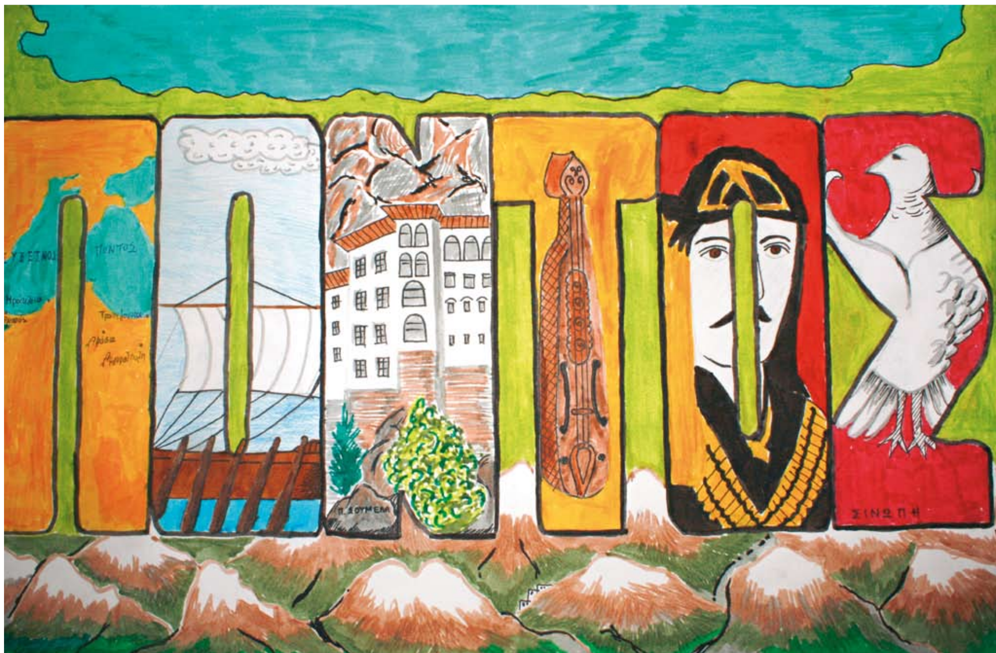
Δημοτικό 10ο Βραβείο: Κουρκουλιώτη Κατερίνα, 8ο Δημοτικό Σχολείο Κορίνθου.